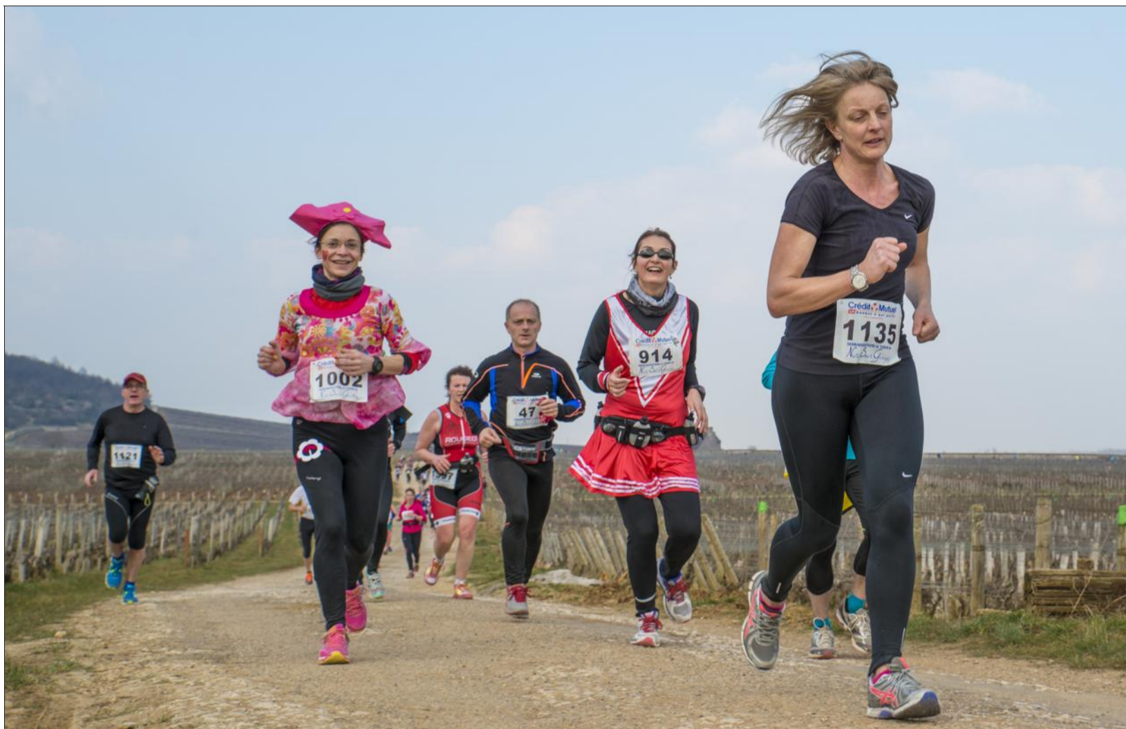
Les kilomètres n'ont pas entamé la bonne humeur des coureurs.