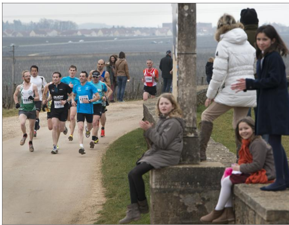
Encouragements soutenus tout au long du parcours. Photo Julien Dromas