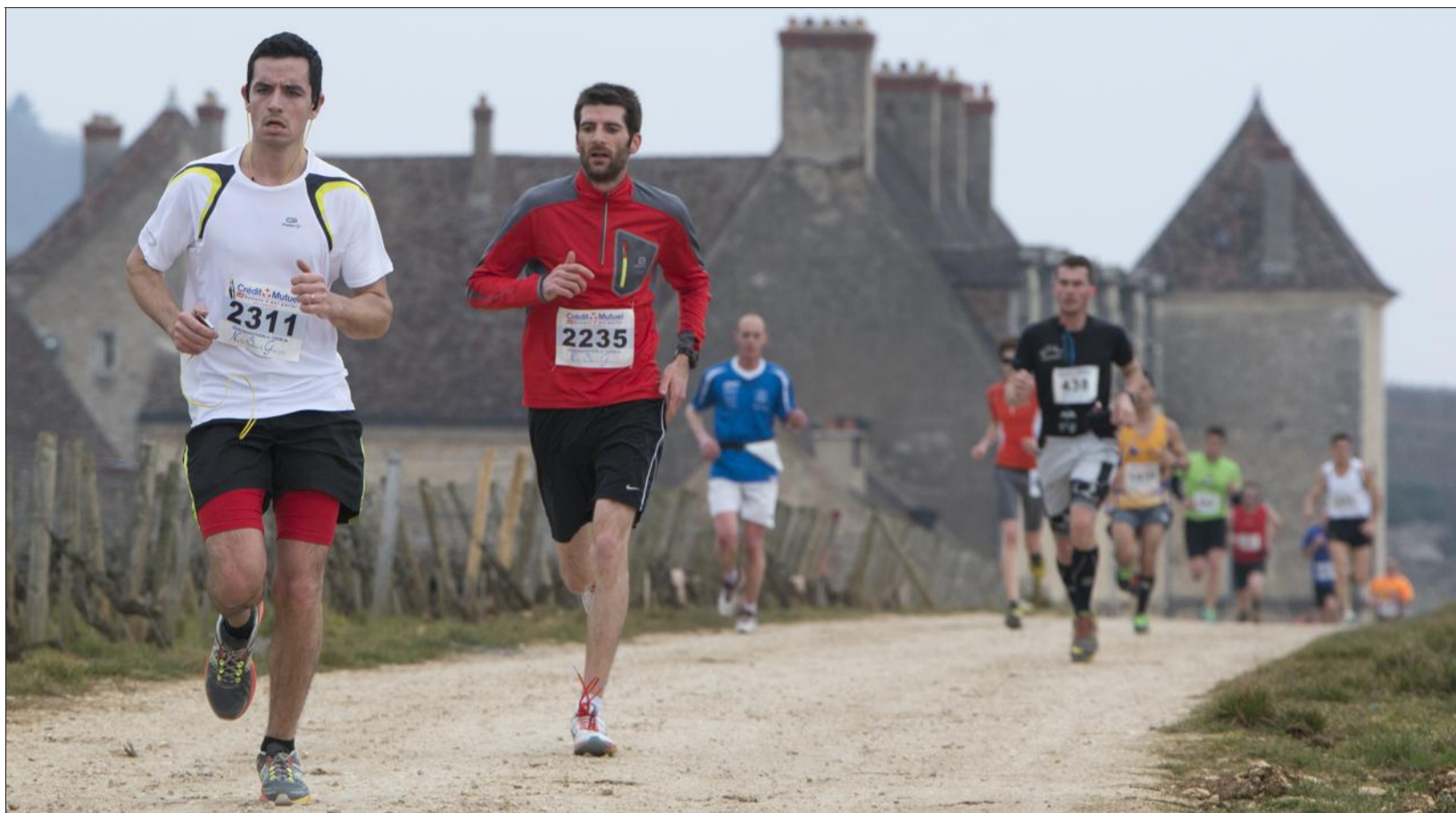
Les superbes paysages nocturnes ont défilé sous les yeux des coureurs amateurs.