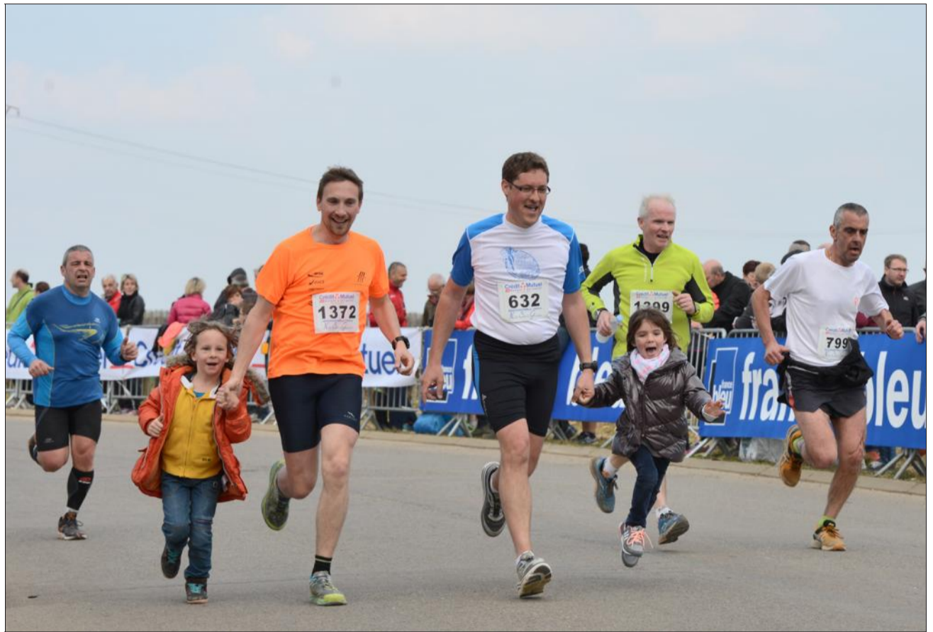
Les enfants sont venus soutenir leurs parents à l'arrivée.