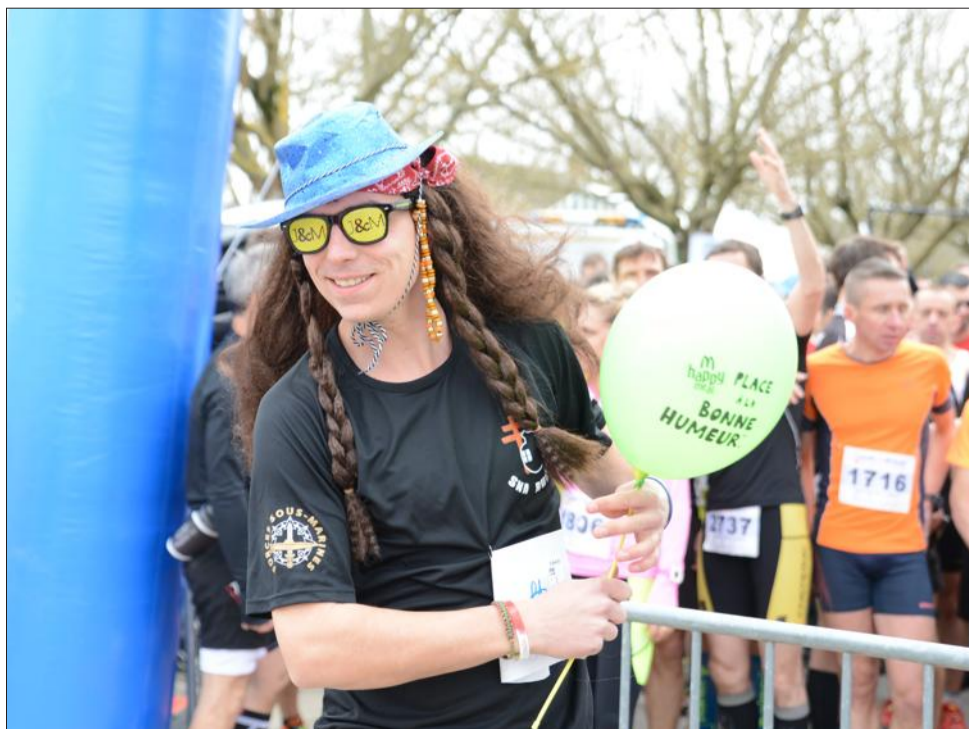
Un peu de bonne humeur avant de s'élaner.