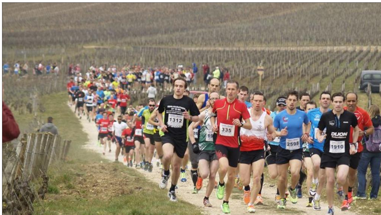
Une longue file de coureurs a emprunté les chemins des vignobles de la côte de Nuits.