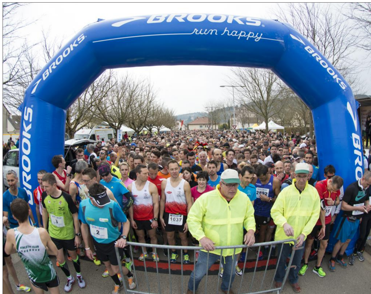
Ils étaient près de trois mille au départ de la 14 e édition du semi-marathon de la Vente des vins de Nuits.