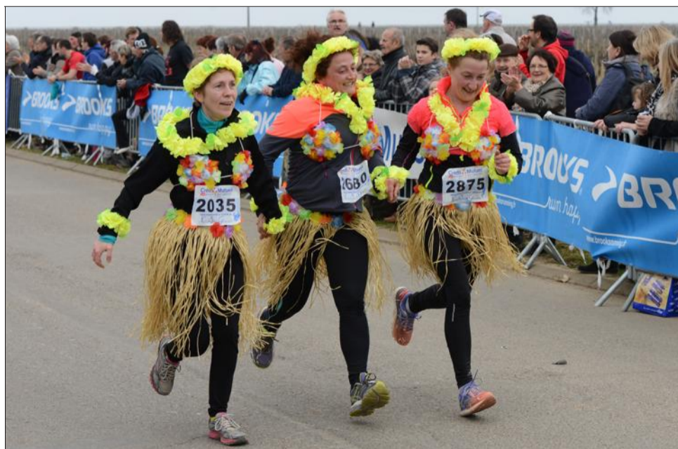
Des vahinés se sont invitées à la course.