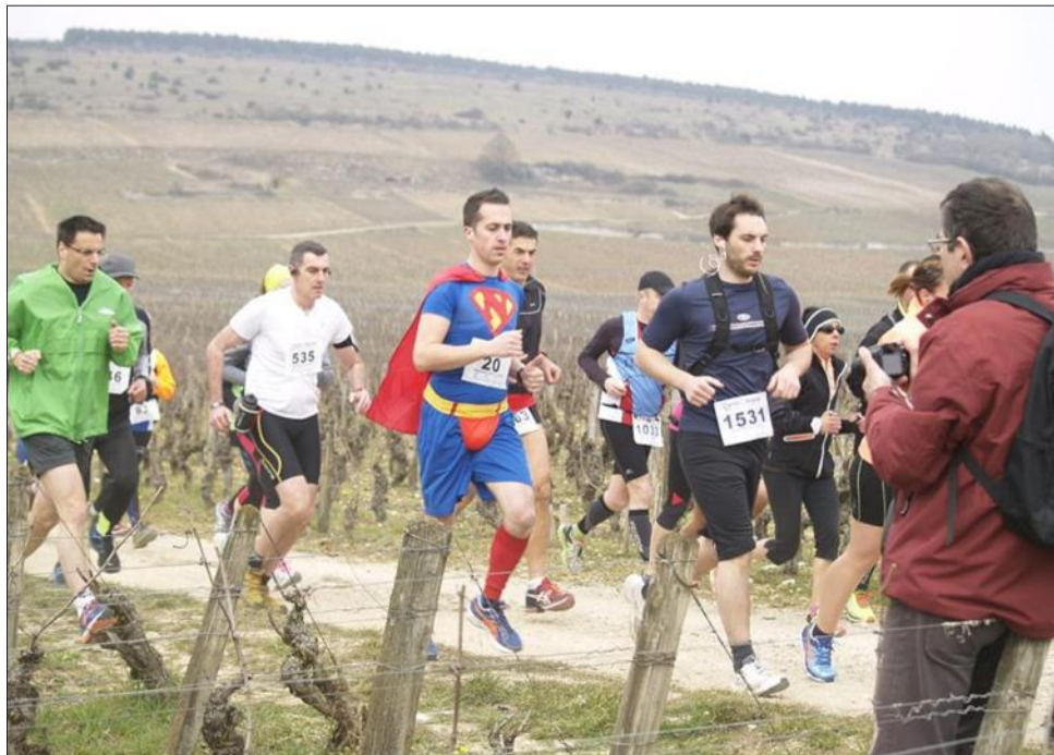
Des super-coureurs dans de drôles de costumes.