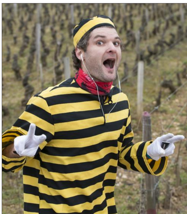
Attrape-moi si tu peux !