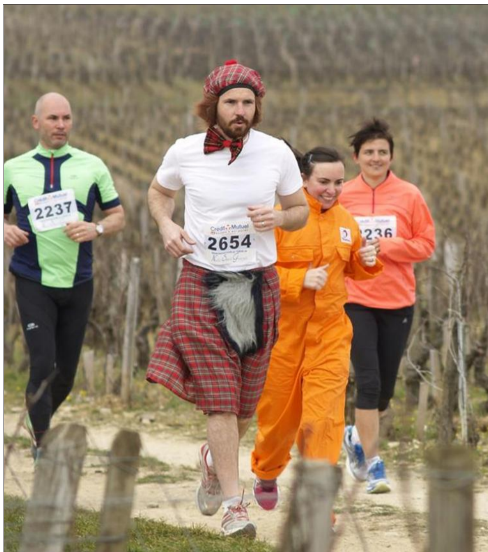
Plusieurs nations étaient représentées à travers les déguisements des participants.