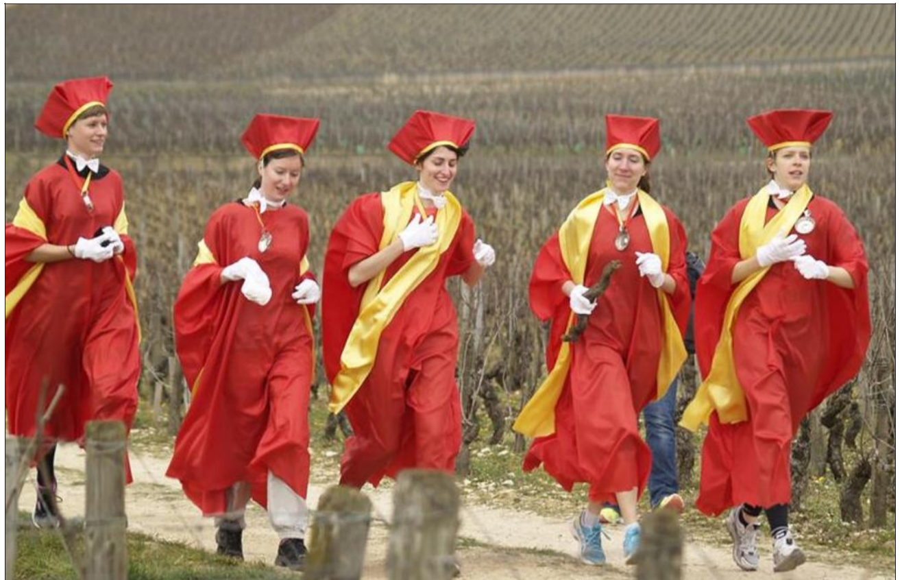
Les Tastevin étaient de sortie samedi à Nuits-Saint-Georges.