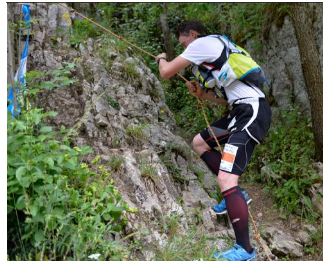
Pour cet UTCO 2015, la polyvalence est requise. Courir, grimper, escalader... Un sacré programme !