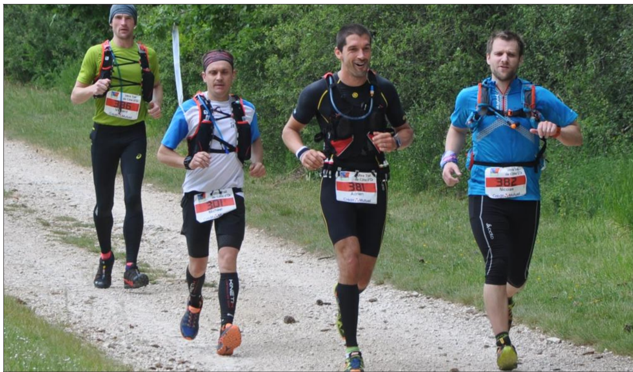
Courir ensemble donne coeur à l'ouvrage et le sourire.