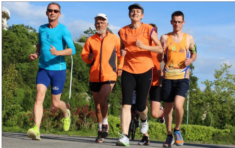
À Dijon, les adeptes du running sont nombreux à courir autour du lac Kir.

Il suffit de se balader un soir de beau temps au lac Kir pour constater le phénomène : tout le long des berges, les adeptes de la course à pied sont nombreux à fouler le pavé en quête de forme physique. Hommes, femmes, jeunes, anciens : l'engouement semble transgénérationnel. Difficile toutefois d'estimer le nombre réel de pratiquants dans l'agglomération dijonnaise, tant il échappe aux données des comités d'athlétisme locaux. Mais pour donner un ordre d'idée, il faut savoir que près de douze mille runners ont concouru en 2014 aux seize courses hors stade (running et trail) organisées dans le secteur. Parmi eux, 75 % n'étaient pas des licenciés de club. Et les fréquentations ne cessent de monter : cette année, les runners seraient entre 15 et 20 % de plus que lors de ces rendez-vous.