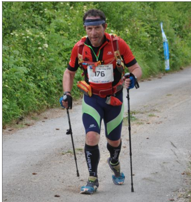
Même lorsque l'on est lanterne rouge du 47 km, il faut s'employer. Chapeau Monsieur !