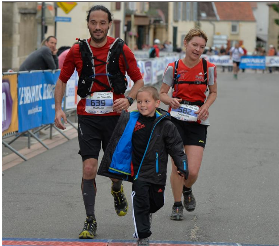
Lorsque l'arrivée est là, le soulagement se fait jour.