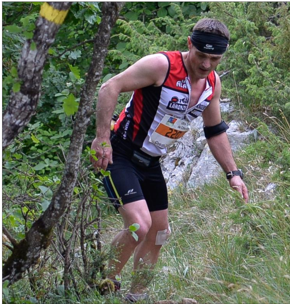
Cet UTCO 2015 a été compliqué entre dénivelé et obstacles naturels, il a fallu avoir la santé... et le moral !